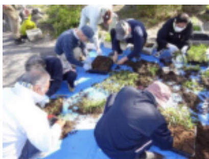
苗移植作業の様子(2.4.25)