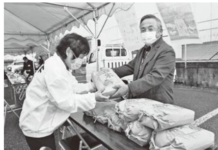
今後もフードドライブは継続して行ってまいりますので、ご協力お願いいたします。

健康福祉委員会の活動は、多くの方々に支えられていきます。民生児童委員の方々やケアマネジャーの皆様はもとより、各地区役員の皆様や各種団体と連絡を密にして、県地区が温かくて優しい街になれ