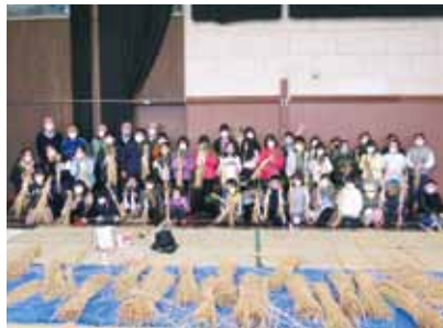
名古熊区おやす作り

り、地域の皆様にも日頃から関心を持っていただき、見守りに役立てていただきたいとの思いからです。また、各支部では通年で登下校時の見守り、あいさつ・声かけ活動を続けてきました。定期的に黄色のベストを着用して見守りを行うことは、間接的にドライバリーにも安全運転を意識させるとともに、地域の防犯にも役立つているものと思います。この2年間難しい運営を余儀なくされましたが、子ども達が安全に過ごせたことに対し、事業に関わっていただいた関係者の皆様、地域の皆様に深く感謝申し上げます。