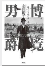
『博覧男爵』志川節子/著 祥伝社2021年

飯田の偉人で「博物館の父」、田中芳男の物語。幕末のパリ万博に参加して衝撃を受けた芳男は、やがて東京上野の博物館や動物園の基礎を築きます。昔の飯田城下を想像しながら読む楽しみもあります。