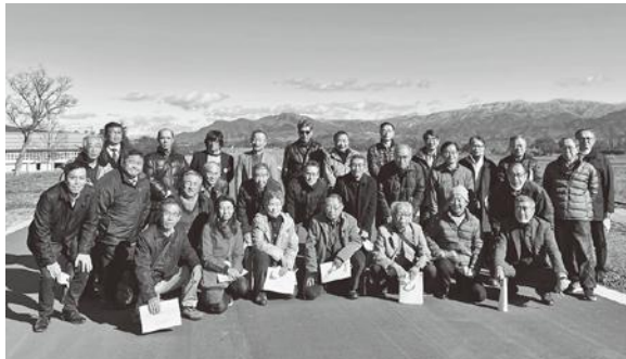
研修視察 千曲川河川敷台風災害現場(長野市)

令和3年度もコロナ感染と共存しながら、地に着いた事業展開が十分に図られず、悔しさと我慢を強いられた一年でした。局面毎の的確な判断のもと工夫を重ね出来る限りの諸事業を推進してこれたことに感慨深く、地域愛とふれあいを大切にする地区民のご支援の賜と感謝申し上げます。今年度は「コロナに負けず元気な地域づくりで将来に夢を」のスローガンに、どんな逆境にもめげず、今できることをチャンスに捉え歩を進めて参りました。重要課題の※複合施設建設については、新市長への覚書確認と長期事業計画の施策に載せ、10年先の姿が見えてきました。※県道青木東線の下山区拡幅は測量