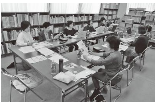
音訳作業の勉強をしています

飯田市立県図書館(県中平) 県声のボランティアグループ 電話 23-9901 FAX 23-9908