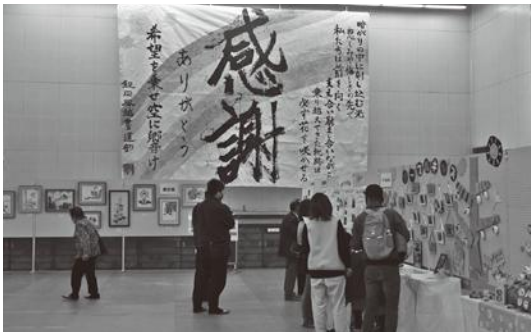
コロナという厳しい中、多くの方に文化祭においでいただきました。改めて感謝申し上げます。