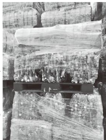
リサイクルセンターに集まるペットボトル

これは県だけでなく、飯田市全体で取り組む必要があることだと思えますが、2年前に皆さんにお願いした「ルールを守ってゴミ出しを」を今一度お願いします。2年間いろいろお世話になりました。