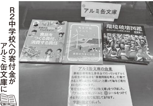
R2中学校への寄付金がアルミ缶文庫に

子どもたちの環境に関する意識を高めてもらうため、県小学校、中学校に寄付も行っています。 昨年度の県中学校への寄付金は、アルミ缶文庫として生徒の皆さんのもとに届けられ学習に役立てられています。