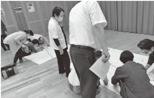
住民支え合いマップを通じて、見守りの漏れがないように