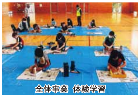
全体事業 体験学習

御さんにとっても、稲刈りは初めての方が多く不安でありましたが、刈り方の手ほどきを受けて始めました。まずは