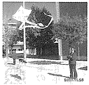
調整すると2時間位でとてもよく上がる凧ができました。

11月25日(日)高齢者双葉会の皆さんに教えてもらい松尾小学校グラウンドで凧を作ってみました。和紙に自分の好きな絵を描いて割り竹を貼って作ります。糸目と張り糸を上手に