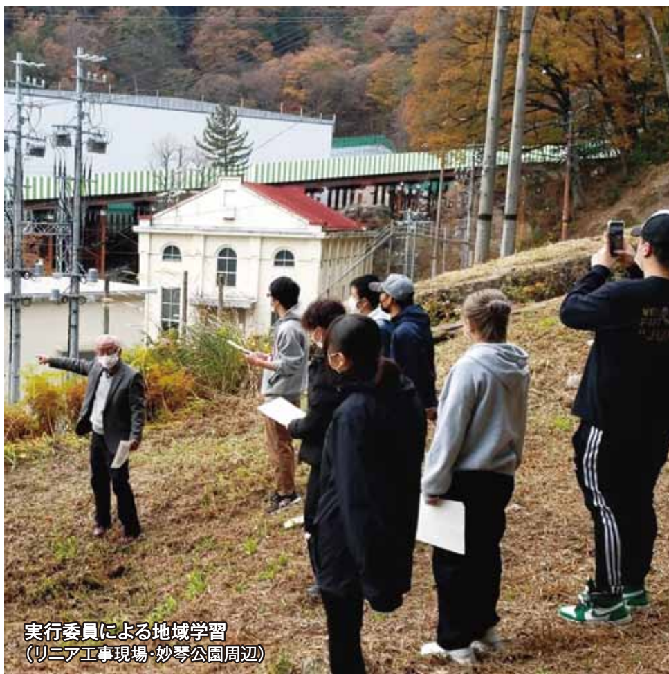
実行委員による地域学習 (リニア工事現場・妙琴公園周辺)