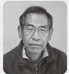
(文 福澤功次、取材 平沢忠広)

現在でも研究者による「歴史の再発見」があり、興味を持ちます。しかし同時に「今、歴史を私たちがつくっている」とする視点から、地域のことなどに関してその時の状況を含めて記録していくことが大事であると思います。